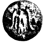
लता-मण्डप बेष्टित भगवान् बाहुबली [देविये, परिशिष्ट १, टिप्पणी ६]

कर चकित किया है कि जैन सस्कृति पुरातथ्यो की कसौटी पर कम-से-कम ५००० वर्ष (३२५० ई०पू०) पुरानी तो है ही। मोहन-जो-दड़ो की सीलो पर योगियो की जो काउस्सग (कायोत्सर्ग) दिगम्बर मुद्राएँ* 'अकित हैं उनसे उक्त स्थापना और दृढ हुई है। मोहन-जो-दड़ो के उत्खनन से जो निष्कर्ष सामने आये है वे इस प्रकार हैं—